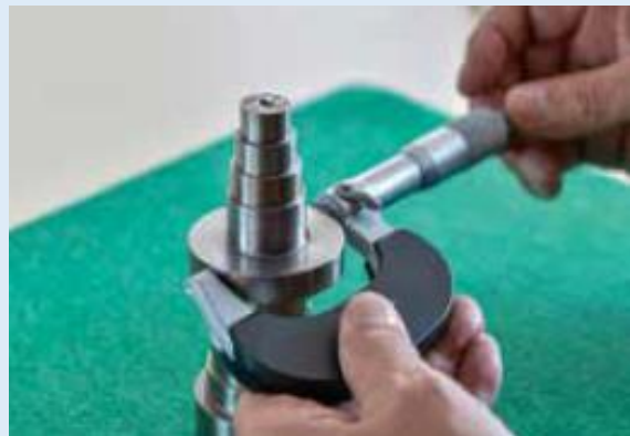
3級技能検定課題実習